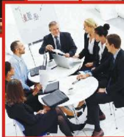
Üzletember- és partnertalálkozók